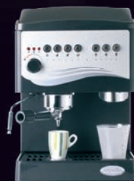
COFFEE & WATER